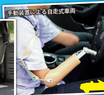
手動装置による自走式車両