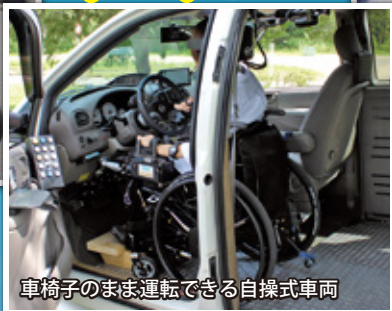
車椅子のまま運転できる自操式車両