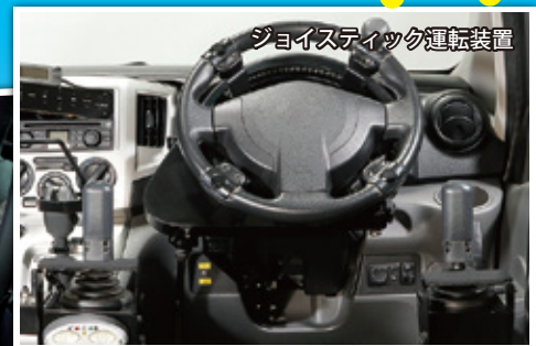
ジョイスティック運転装置