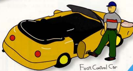
Foot Control Car