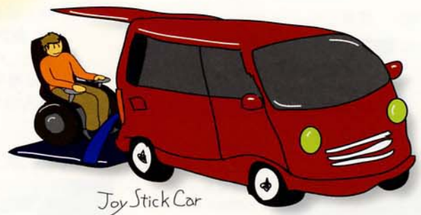
Joy Stick Car