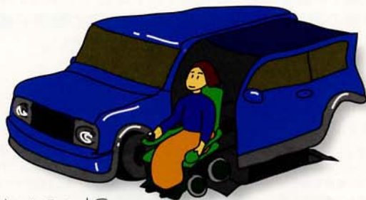
Hand Control Car